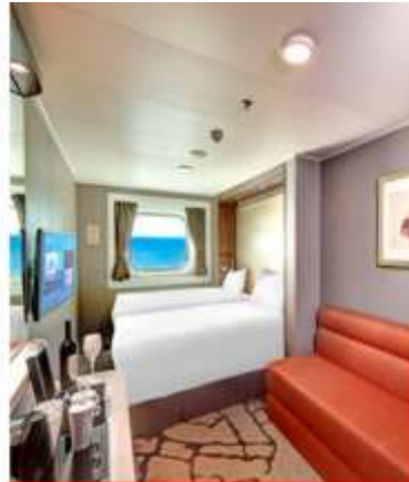
Oceanview Stateroom with Window