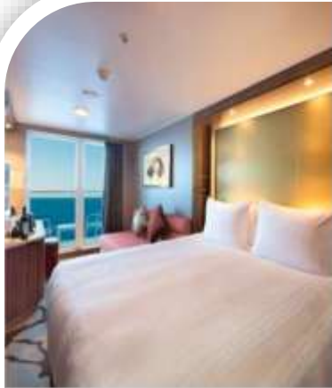
Oceanview Stateroom with Balcony