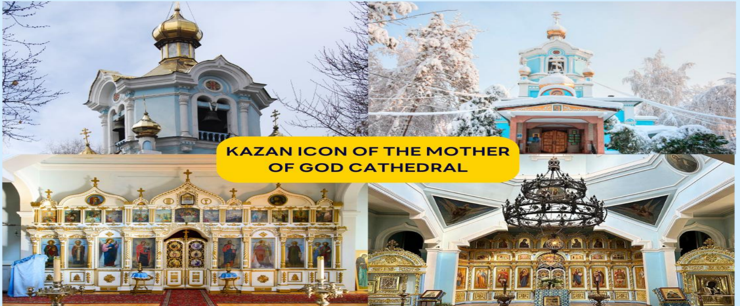
KAZAN ICON OF THE MOTHER OF GOD CATHEDRAL

นำท่านชม โบสถ์ไค้ดินคาซาน (Kazan Icon of the Mother of God Cathedral) สภาที่ศักดิ์สิทธิ์อีกลับไค้ดินแห่งเมืองอัลมาตีถูกซ่อนอยู่ในถ้ำไค้ดิน สร้างขึ้นโดยฝีมือช่างชาวรัสเซียในช่วงต้นศตวรรษที่ 20 เพื่อเป็นสถานที่ประกอบพิธีกรรมทางศาสนา ด้านในโบสถ์ตกแต่งด้วยภาพจิตรกรรมของชาวคริสตนิกายออร์โธดอกซ์บรรยากาศเย็นสงบ และเต็มไปด้วยยมนต์ขลัง