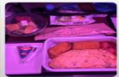
บริการอาหารร้อน ทั้งขาไป และ ขากลับ