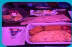
บริการอาหารร้อน ทั้งขาไป และ ขากลับ