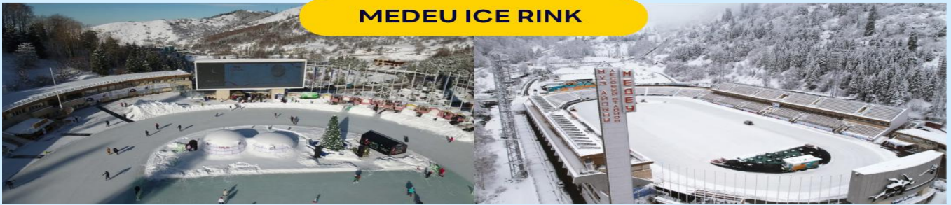
MEDEU ICE RINK

นำท่านสู่ ลานสกีเกิดน้ำแข็งเมเดว ไช้ริงซ์ เป็นลานสกีเกิดน้ำแข็งกลางแจ้งที่มีชื่อเสียงระดับโลก ตั้งอยู่บนความสูงประมาณ 1,691 เมตรเหนือระดับน้ำทะเล ท่ามกลางทิวทัศน์ภูเขาเทียนชาน ห่างจากตัวเมืองอัลมาตีเพียง ประมาณ 30 นาที โดยรถยนต์ ลานสกีแห่งนี้ขึ้นชื่อเรื่องคุณภาพน้ำแข็งที่ยืดหยุ่นและบรรยากาศที่อบอุ่นด้วยธรรมชาติอันงดงาม นักท่องเที่ยวสามารถสัมผัสประสบการณ์การเล่นสกีท่ามกลางอากาศเย็นสดชื่น หรือเพียงเก็บภาพความประทับใจจากวิวภูเขาและบรรยากาศรอบข้างก็ได้เช่นกัน